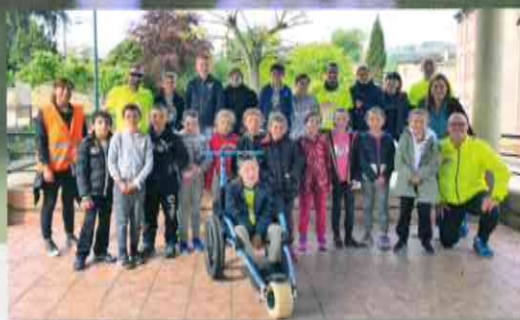
Rencontre avec Martinou le Crapailou.